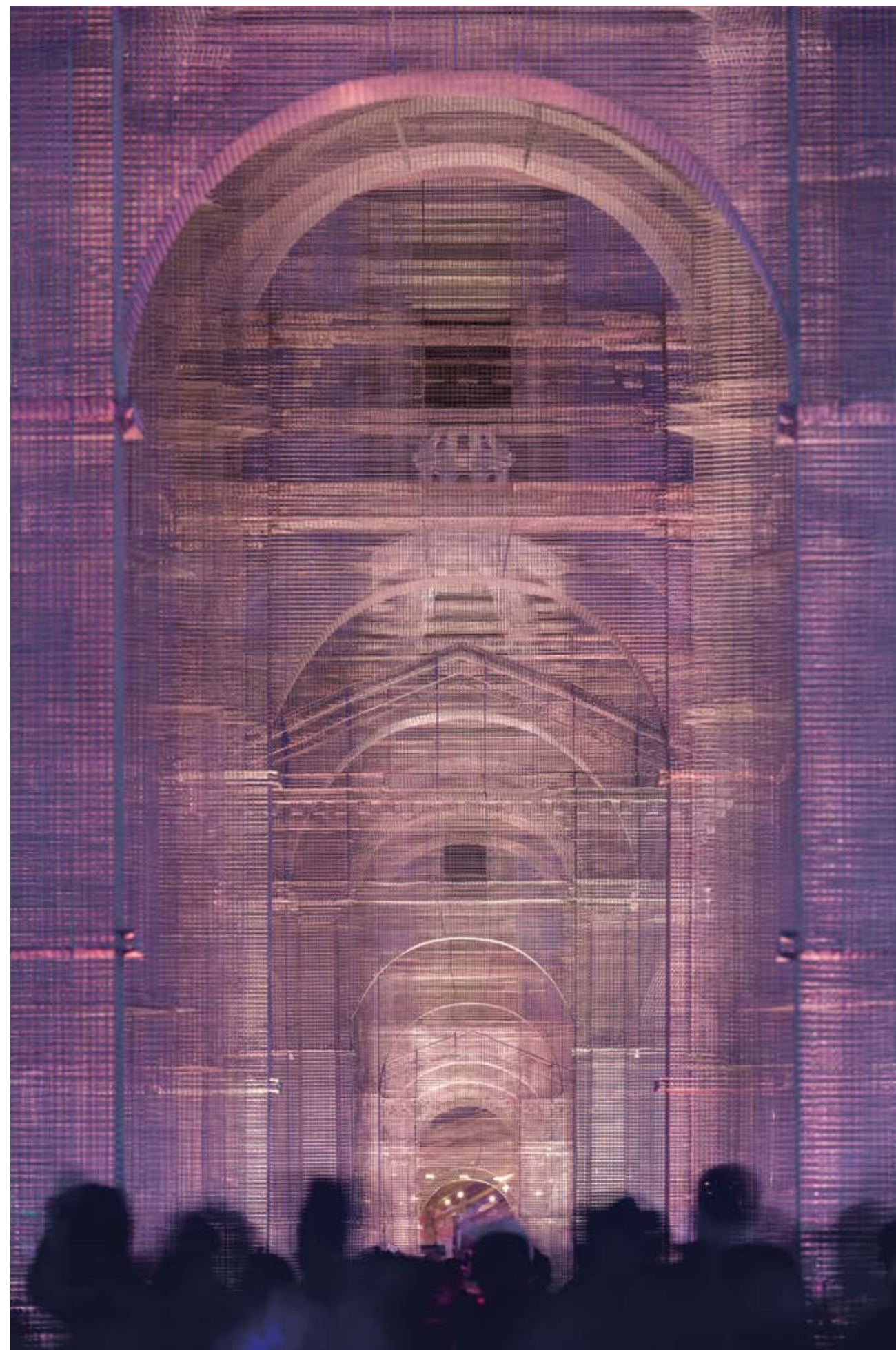
Edoardo Tresoldi, Etherea (Etérea) , 2018. Cortesía del artista. Fotografía de ©Roberto Conte. edoardotresoldi.com

La transparencia que ofrece la malla como material de trabajo otorga a sus piezas diferentes densidades, experiencias y efectos en función del contexto y de la luz natural y artificial, convirtiéndolas en espacios altamente dinámicos. El aspecto de su obra es reminiscente a trazos arquitectónicos que en lugar de ubicarse en un papel se proyectan tridimensionalmente en el espacio y el paisaje. Por otro lado, desde una mirada más tecnológica y contemporánea, evoca a los dibujos de nube de puntos que se obtienen de tecnologías para escaneo tridimensional, utilizados en el levantamiento de obras arquitectónicas de valor patrimonial. No obstante, sus piezas se materializan de forma artesanal y manual, lo que demuestra una maestría técnica en el